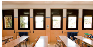
Rehabilitación CEIP Marià Galí - Arquitecto: Amadeu Oliva