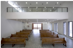
Iglesia El Redemptor - Arquitecto: Amadeu Oliva